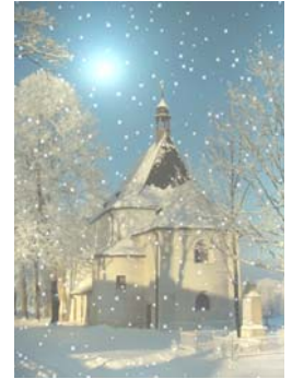
(Die Kirche wird beheizt)